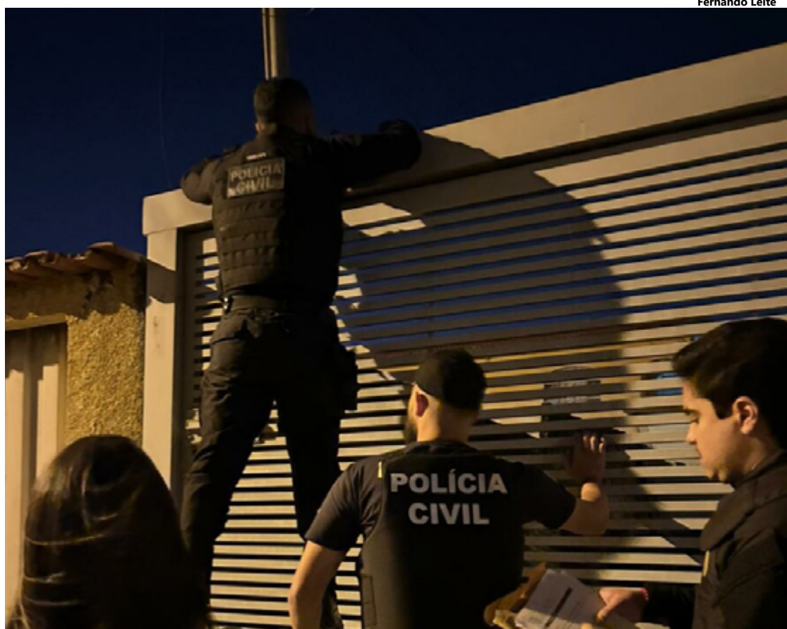
Na operação da sexta-feira, cinco dos nove suspeitos foram localizados e presos em diferentes localidades do Distrito Federal (DF)

Após o ataque, a Polícia Militar iniciou diligências