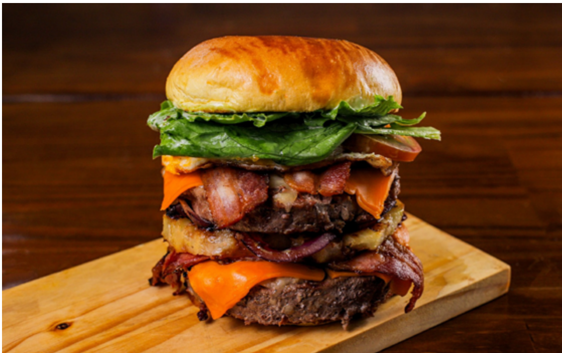
Promovido com recursos do Programa Goyazes do Governo Do estado, evento tem apoio da Goiás Turismo