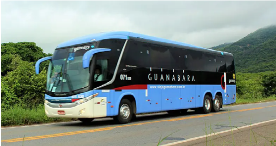
A rota atende Anápolis, Abadiânia, Alexânia, Planaltina de Goiás, São Gabriel de Goiás, São João d'Aliança, Alto Paraíso de Goiás, Teresina de Goiás e Cavalcante

Segundo destacou, a AGR lançou quatro editais de chamamento público para habilitação de empresas visando atender novas linhas, como a que agora beneficia o município de Cavalcante. Ao todo, 40