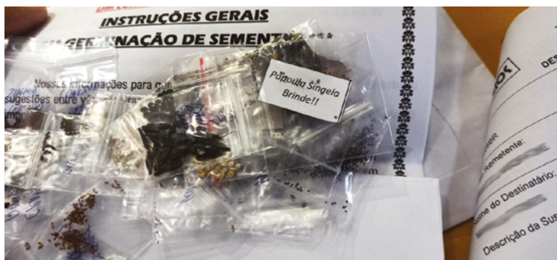
Ação fiscaliza sementes, mudas e plantas vivas ilegais e faz vigilância ativa de produtos agropecuários

O acordo de cooperação prevê a realização conjunta