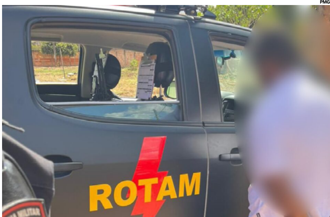
A vítima, um senhor de 63 anos, foi encontrada sem vida dentro de um veículo estacionado na rua

A identificação da vítima foi realizada rapidamente, e familiares forneceram detalhes sobre seus últimos movimentos antes do crime. Com essas informações, policiais civis e militares iniciaram diligências para identificar e prender o autor do homicídio. As investigações levaram à localização do suspeito, um jovem de 20 anos, no bairro Jardim Ingá, em Luziânia. Na abordagem, vestígios de sangue foram encontrados nas roupas do suspeito, e ele estava de posse do celular da vítima.