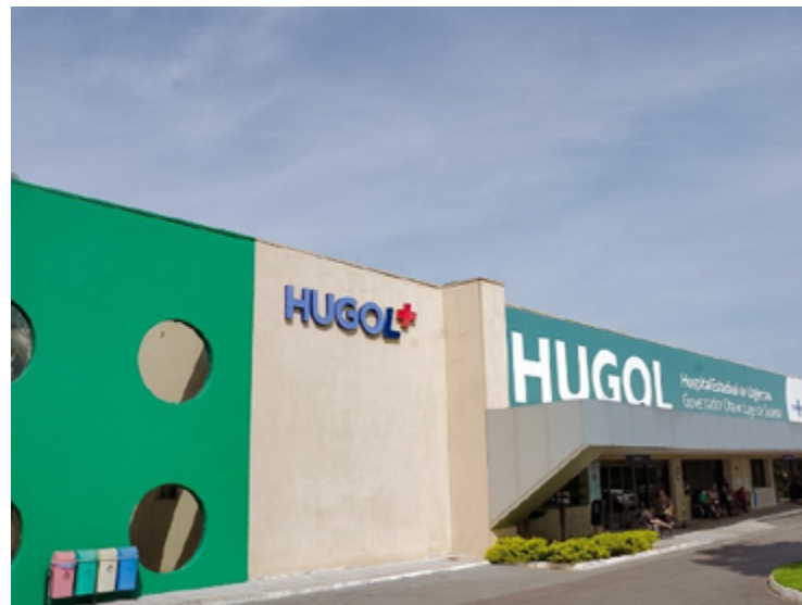
Hugol possui uma ala especializada no atendimento a pacientes com queimaduras

Durante o mês de junho, o risco aumenta por causa do uso de fogos de artifício, fogueiras e comidas quentes