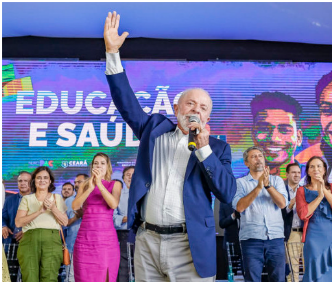
Lula da Silva: peregrinação aos estados para favorecer candidatos apoiados pelo governo

Conforme o presidente, onde não tiver candidato do PT, ele apoiará os aliados ao governo. Afirmou ainda que fará o necessário para que os adversários não ganhem as eleições. “Onde eu não tiver candidato, eu vou apoiar o candidato aliado. O que eu não quero é que os adversários ganhem, porque os adversários são negacionistas. Eles não