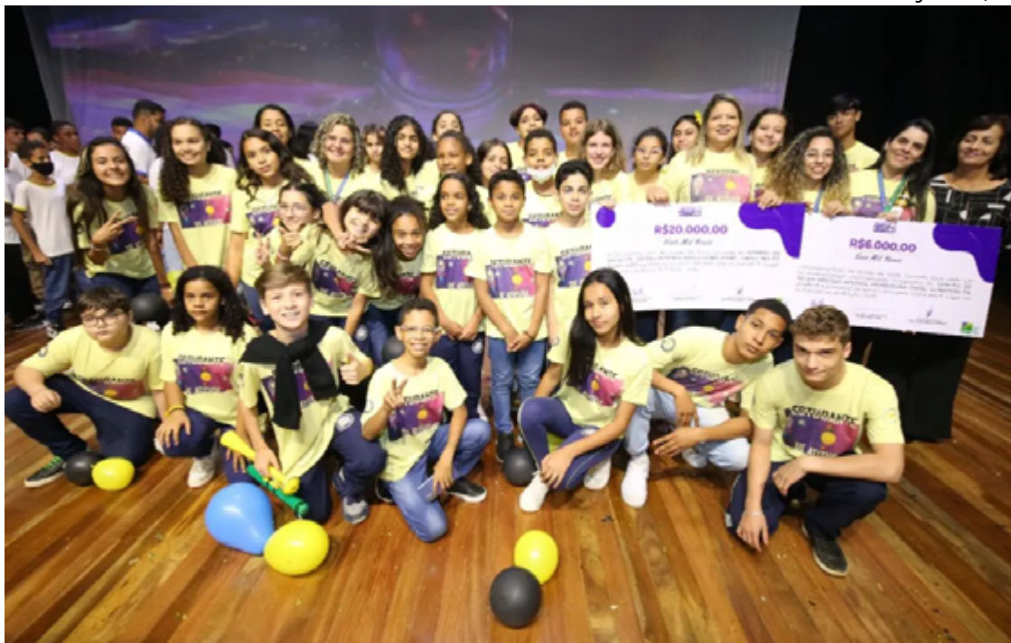
Finalistas serão convidados para a cerimônia de premiação durante a 23ª Conferência do OIDP em Valongo, de 17 a 19 de outubro

Os finalistas serão convidados para a cerimônia de premiação durante a 23ª Conferência do OIDP em Valongo, de 17 a 19 de outubro de 2024. Além disso,