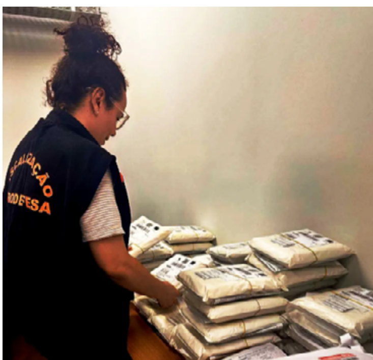
Accionada pelos Correios, fiscalização da Agrodefesa verifica pacotes suspeitos com mudas e sementes